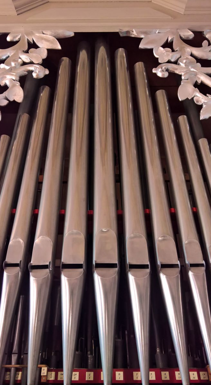
Dettaglio della facciata dell'organo di Brione: le canne in mostra sono del Principale 8'