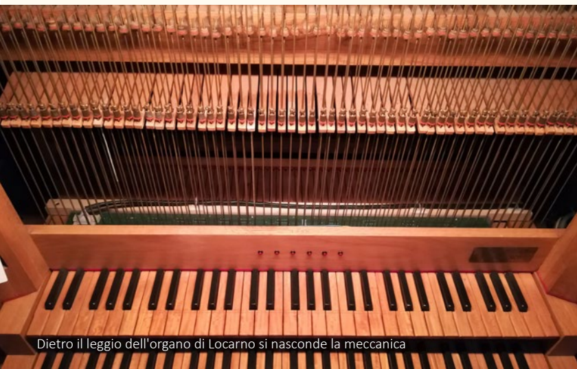
Dietro il leggìo dell'organo di Locarno si nasconde la meccanica