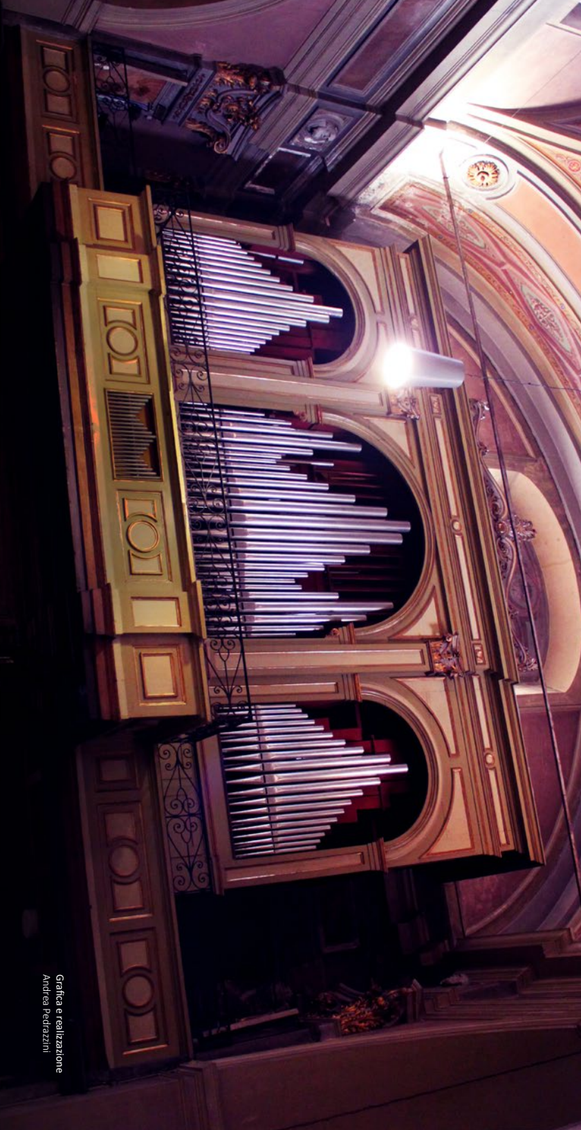
Grafica e realizzazione Andrea Pedrazzini