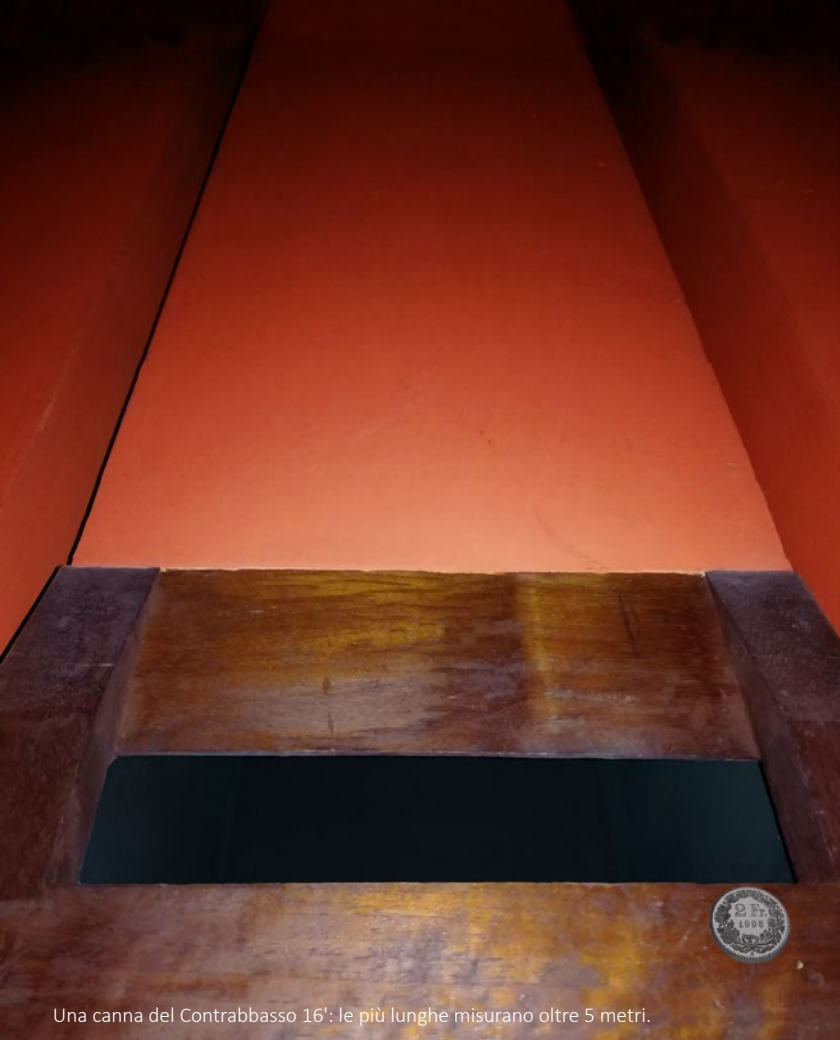
Una canna del Contrabbasso 16': le più lunghe misurano oltre 5 metri.

Nel dicembre del 1990 il municipio chiese un credito suppletorio per la completazione del restauro affidato alla ditta Italo Marzi di Pongo che, oltre ad essere la migliore offerente, risultava essere la più disponibile ad eseguire i lavori nei termini richiesti. Fu inoltre previsto un contributo straordinario per le giornate inaugurative di quest'organo ed il restauro "conservativo e integrativo" terminò nel maggio del 1991.