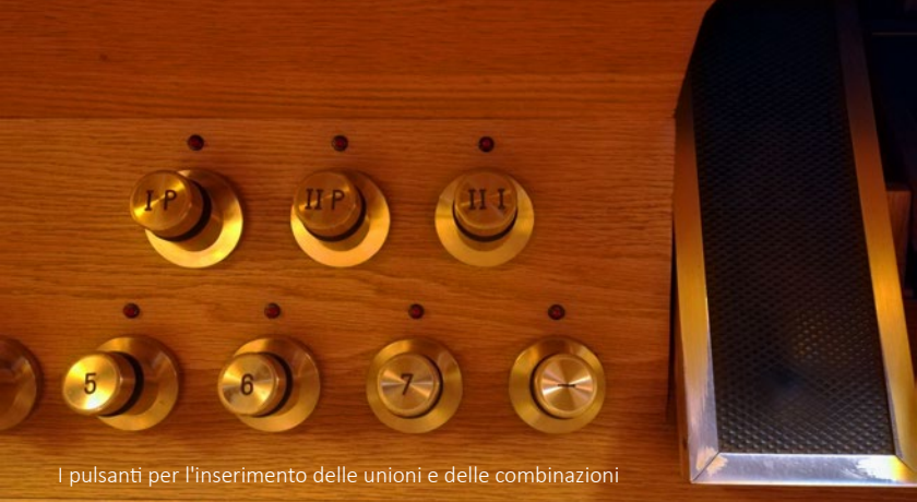
I pulsanti per l'inserimento delle unioni e delle combinazioni

Oltre al rinnovato organo della Collegiata, la fervida attività artistica degli ultimi anni è stata determinante per stimolare l'esecuzione di altri importanti restauri e ampliamenti degli strumenti nella regione. Fra questi l'organo della Parrocchiale di Brione s. Minusio, che è stato restaurato nella parte storica nonché notevolmente ampliato ed inaugurato lo scorso anno dal più rinomato organista mondiale, Olivier Latry, organista della cattedrale di Notre-Dame a Parigi, e l'organo della Parrocchiale di Solduno, in fase di completo restauro, che verrà inaugurato quest'anno.