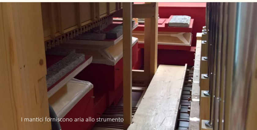
I manti forniscono aria allo strumento

L'ambizioso progetto per l'organo di Brione ha dunque preso le mosse da qui, ed in particolare dalla volontà di realizzare uno strumento in grado di restituire, con proprietà di stile, il repertorio romantico-sinfonico, con particolare riferimento alla scuola francese. Fondamentali in questa estetica sono principalmente due sonorità: i cosiddetti fondi, ossia registri labiali di 16, 8 e 4 piedi che compongono la sonorità base dell'organo e che, nell'estetica romantica, simulano sull'organo il maestoso impasto sonoro degli archi dell'orchestra sinfonica e le ance che, rinchiuso in cassa espressiva, devono fornire allo strumento la capacità di ricreare il crescendo dell'orchestra sinfonica ruolo in quel caso assunto principalmente dai corni francesi.