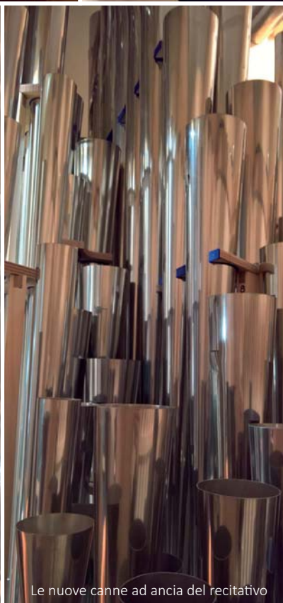
Le nuove canne ad ancia del recitativo