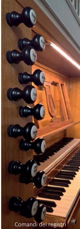
Comandi dei registri