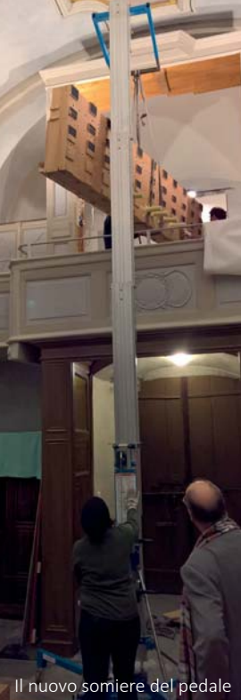
Il nuovo sommere del pedale