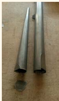
Canna di facciata in fase di restauro

Nella scelta delle sonorità da inserire nel nuovo corpo d'organo ci si è ispirati all'organaria coeva all'organo di Brione, ossia quella del periodo tardo romantico, principalmente ispirata alla scuola organaria francese, che già fu importante fonte di ispirazione anche in Italia proprio fra la fine del XIX e l'inizio del XX secolo, all'interno del movimento ceciliano di riforma della musica sacra.