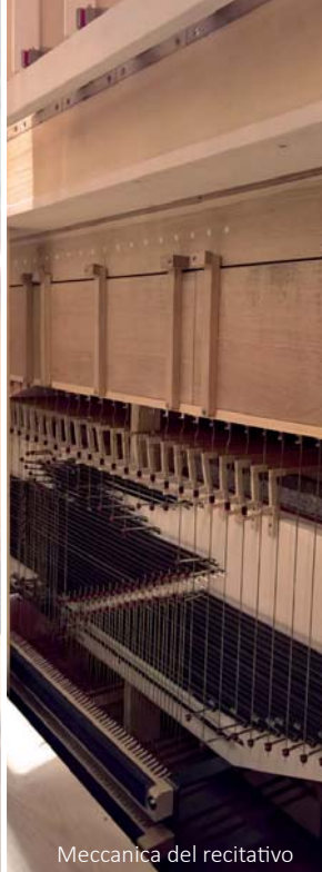
Meccanica del recitativo