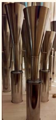
Particolare del nuovo Oboe del recitativo

Brione sopra Minusio può oggi vantare uno degli strumenti più caratterizzati