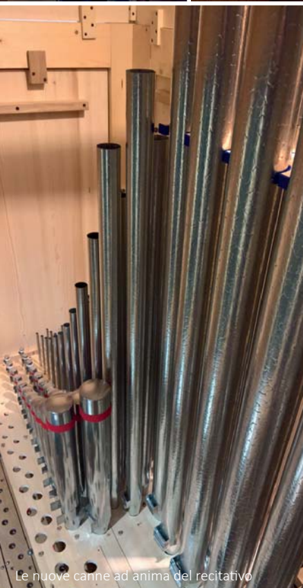
Le nuove canne ad anima del recitativo