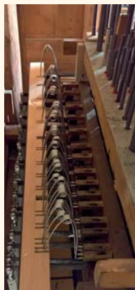
Azionamento dei pettini del somiere maestro

Die Auswahl des Tones (Schalles) in der neuen Orgel wurde beeinflusst von der bestehenden alten Orgel von Brione, beziehungsweise von der späten romantischen Zeit die hauptsächlich von der französischen Orgelbauschule beeinflusst wurde, umschrieben in Italien durch den Cäcilianismus.