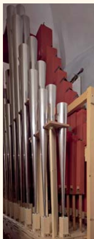
Sezione del pedale: la nuova Bombarda 16' in metallo; dietro il Basso 8' e il Contrabbasso 16'.

Der Einklang der Orgel, beziehungsweise die schwierige und minuziöse Regulierung jeder einzelnen Pfeife, wie vorher erwähnt, kann nur am Ort wo sie installiert ist und im Einklang mit den anderen Pfeifen der Orgel optimal eingestellt werden - allein diese Arbeiten haben etwa vier Monate Arbeit in der Kirche in Anspruch genommen. Die Tonalität der neuen Pfeifen, die wieder gleich wie anfangs des 20igsten Jahrhunderts tönen sind kaum unterscheidbar auch vom Musikexperten, wie vom Publikum, dass es sich um restaurierte Pfeifen handelt.