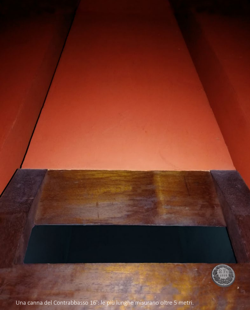
Una canna del Contrabbasso 16': le più lunghe misurano oltre 5 metri.