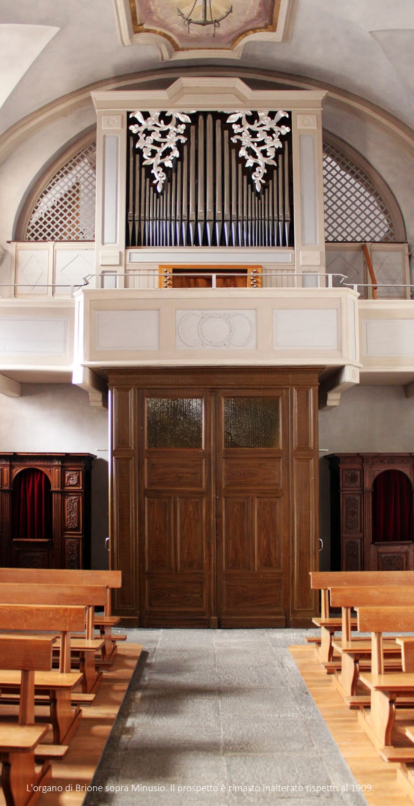
L'organo di Brione sopra Minusio. Il prospetto è rimasto inalterato rispetto al 1909.