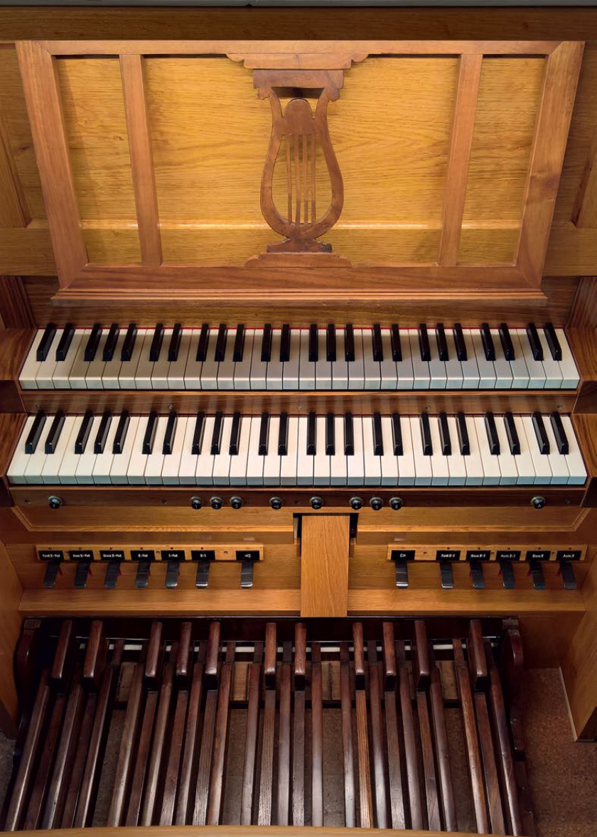
La consolle dell'organo di Brione