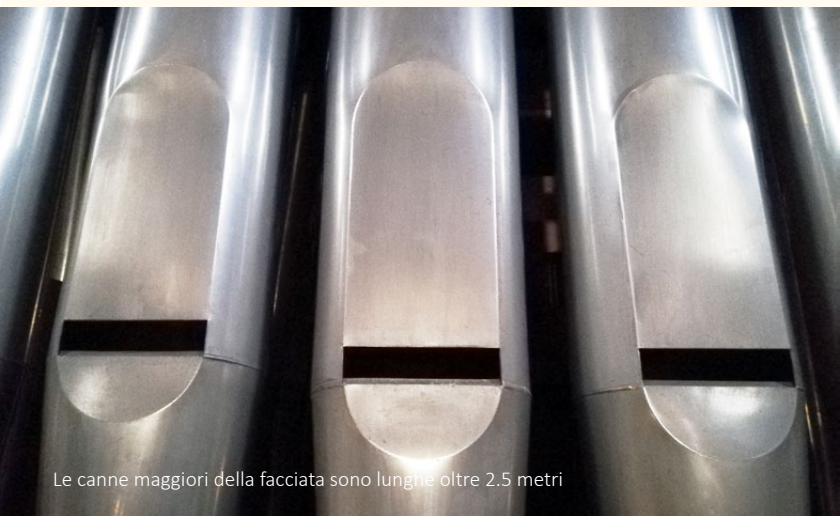
Le canne maggiori della facciata sono lunghe oltre 2.5 metri

Nel 1984 l'Associazione ricerche musicali nella Svizzera italiana consigliò al Municipio un restauro dell'organo nuovamente condannato al silenzio dal progressivo processo di deperimento. Avendo riconosciuto il valore storico degli organi costruiti sull'esempio di Serassi dalla ditta Bossi Urbani, il Consiglio Comunale di Locarno votò nel marzo del 1986 il credito necessario per il restauro. Dopo le necessarie analisi degli esperti, nel marzo del 1988 fu pubblicato il relativo capitolato di concorso per "il restauro dell'organo sito nella collegiata di St. Antonio abate e S. Vittore martire a Locarno."