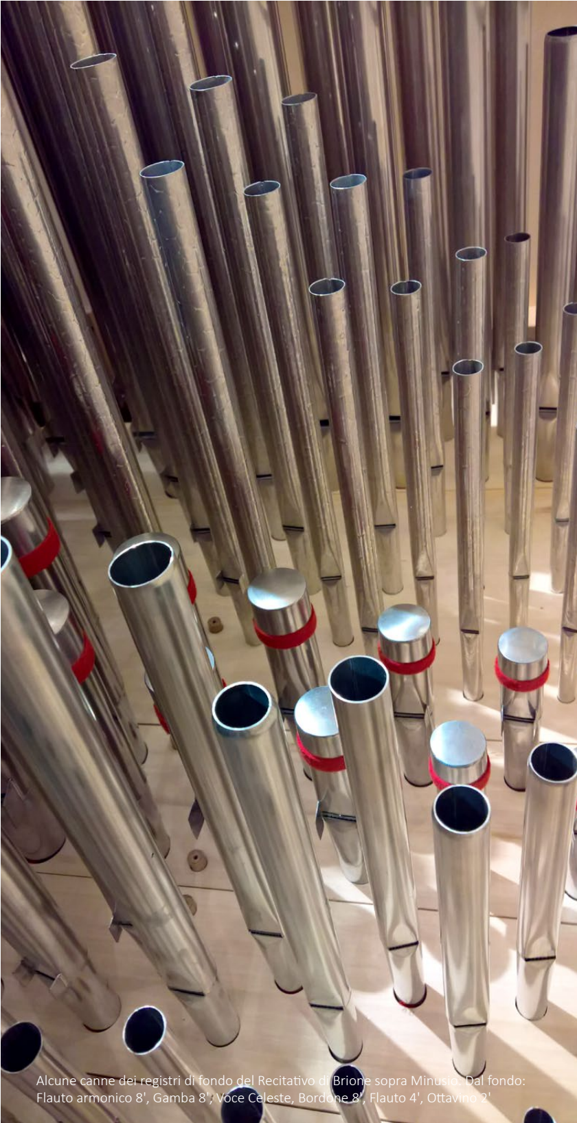
Alcune canne dei registri di fondo del Recitativo di Brione sopra Minusto. Dal fondo: Flauto armonico 8', Gamba 8'; Voce Celeste, Bordone 8', Flauto 4', Ottavino 2'