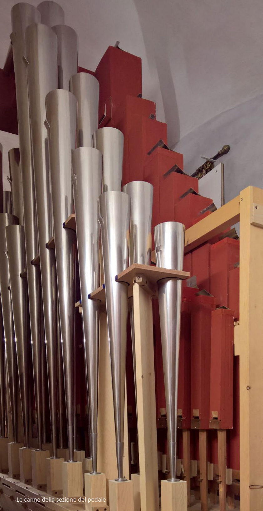
Le canne della sezione del pedale