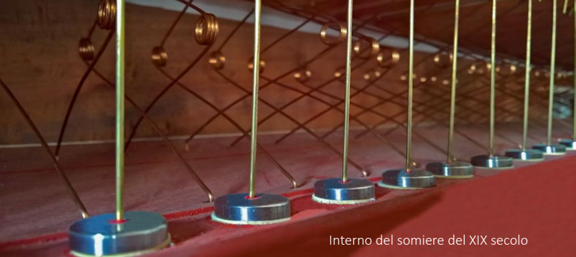
Interno del somiere del XIX secolo

D'altro canto, la sonorità cristallina del bel Ripieno dell'organo di Brione, oltre a fornire ulteriore spinta sonora verso l'acuto allo strumento, dotandolo del necessario equilibrio per bilanciarsi all'interno dello spettro acustico che sarebbe altrimenti eccessivamente sproporzionato verso il grave, ne avrebbe allargato enormemente la versatilità, consentendo l'esecuzione di un repertorio molto ampio.