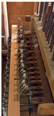
Azionamento dei pettini del somiere maestro

D'altro canto, la sonorità cristallina del bel Ripieno dell'organo di Brione, oltre a fornire ulteriore spinta sonora verso l'acuto allo strumento, dotandolo del necessario equilibrio per bilanciarsi all'interno dello spettro acustico che sarebbe altrimenti eccessivamente sproporzionato verso il grave, ne avrebbe allargato enormemente la versatilità, consentendo l'esecuzione di un repertorio molto ampio.