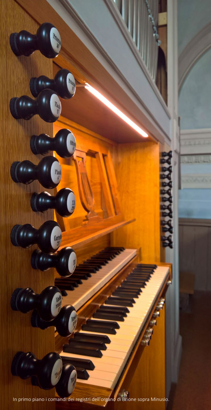
In primo piano i comandi dei registri dell'organo di Brione sopra Minusio.