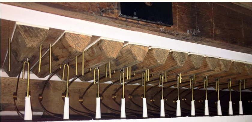
Somiere maestro dell'organo di Solduno (1714)